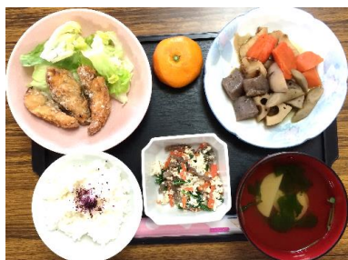
手作りのお昼ごはん