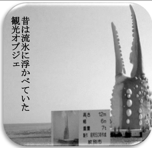
昔は流水に浮かべていた 観光オブジェ

の出岬ホテル」。このホテルは岬の先端の高台にあり、温泉に入りながら1月下旬から流水を眺めることができます。食事もカニ、ホタテ、鮭と魚介類が豊富です。私は、蕎麦屋のバイトで年越しをした時に店主が開いてくれる新年会でカニを食べるのが楽しみでした。ちなみに、学生時代に田舎にいたからか、未だに東京の地理がまったく分からないのが難点です。