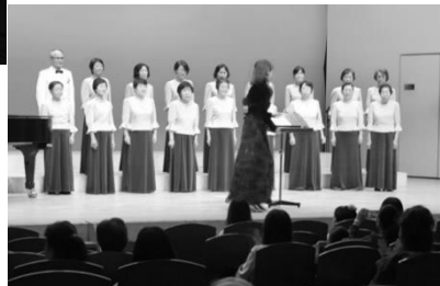
混声合唱団の歌声