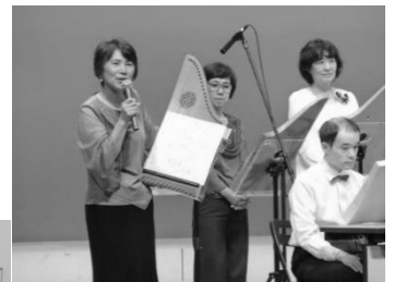
ヘルマンハープの演奏