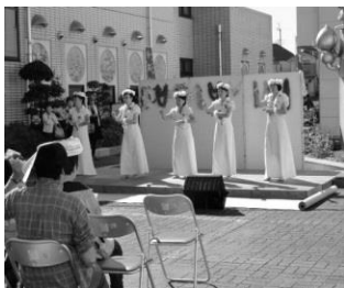
藤久保みらい広場での フラダンス