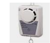
煙、ガス漏れ、音声、壁

設置場所は、寝室、居間、階段の天井や、台所の壁や天井などで、火事の発生を煙や熱で感知すると、「ピューピュー」という音や「火事です！ 火事です！」という声で、すばやく危険を知らせてくれる機器です。消防庁調べの統計によるとこの警報器を設置している場合は、場合設置していない場合に比べ、死者の発生数は約4割減、損傷床面積、損害額はおおむね5割減という効果が表れているそうです。