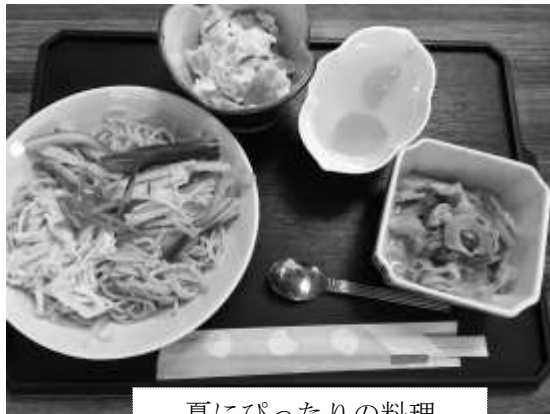
夏にぴったりの料理

＜この新聞は、藤久保2区3区内で65歳以上・ひとり暮らしの方にお届けしています。＞