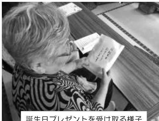
誕生日プレゼントを受け取る様子

あいにくの台風のため、食事の後は、10月に予定している鉄道博物館へのバス旅行の説明をしました。参加者の方々は説明が終わり次第、天気が変わるまえに、すみやかに帰路につきました。