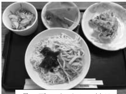
暑い夏にぴったりの料理

7月25日(水)、藤久保2・3区65歳以上の一人暮らしの方の集い「福寿草の会」が社協の家で開催されました。今月のメニューは「貝だくさんのそうめん」「ポテトチップス入り野菜サラダ」「かき揚げ」「スイカ」でした。