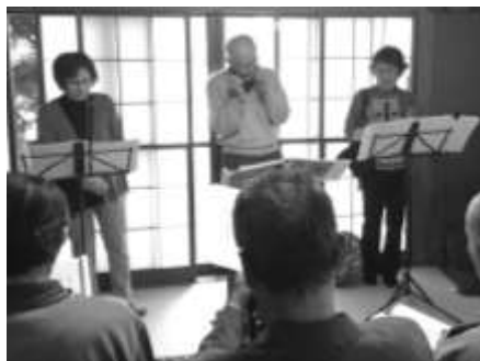
ハーモニカ演奏の様子

食事の後は、皆様お待ちかねのイベントです。5月のイベントは「みよしのハーモニカクラブ」さんによるハーモニカの演奏でした。青春時代を思い起こさせるような、往年の昭和歌謡を中心に演奏していただきました。