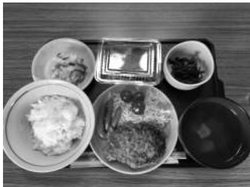
毎月恒例の手作りの食事

5月9日(水)、藤久保2・3区65歳以上の一人暮らしの方の集い「福寿草の会」が社協の家で開催されました。今月のメニューは「鶏のつくねハンバーグ」「ポテトサラダ」「ほうれん草の胡麻よごし」「味噌汁」「柏餅」でした。5月によく食べられる柏餅ですが、新しい葉が育つまで古い葉が落ちないという柏の葉が、子孫を絶やさない縁起が良い物とされ、食べられるようになったそうですよ。