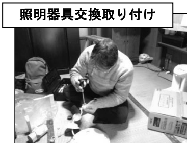
照明器具交換取り付け