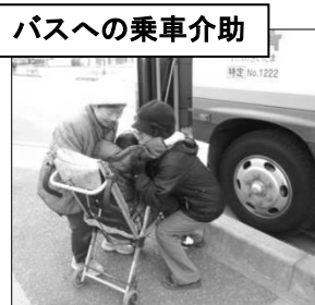
バスへの乗車介助