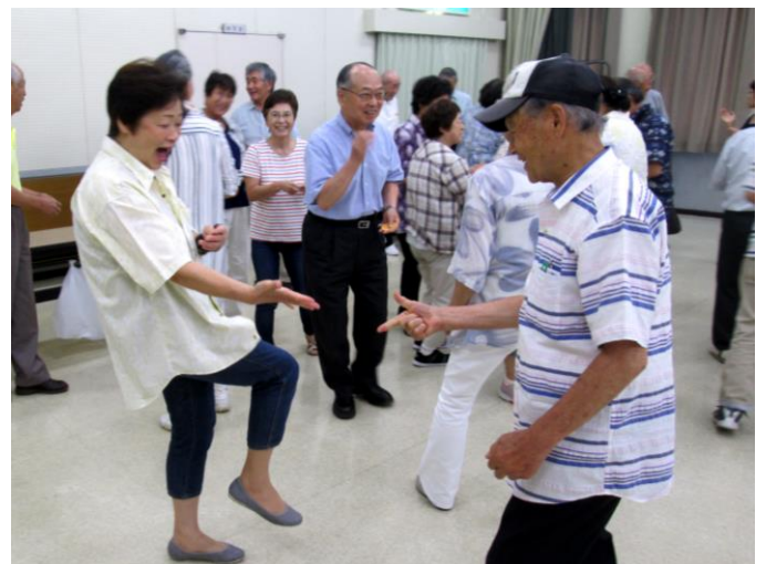
ジャンケンゲーム